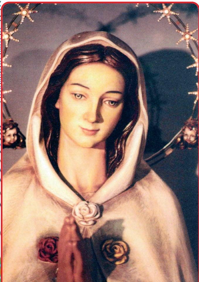
MADONNA ROSA MISTICA

Benedette le famiglie che onorano la mia immagine