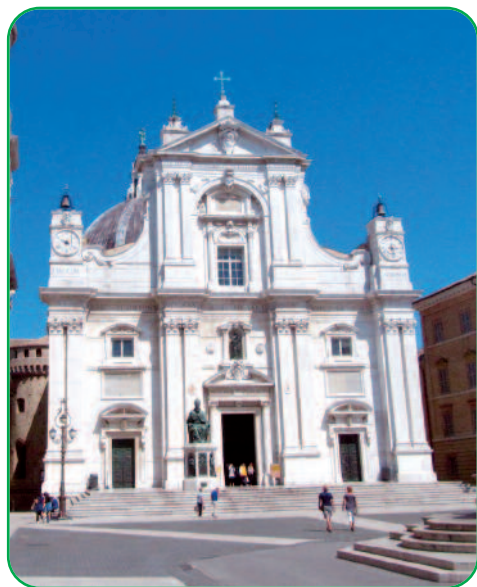
Basilica di Loreto

"Andarono dunque e videro dove egli dimorava e quel giorno rimasero con lui" (Gv 1,39) era mercoledì 25 marzo 2020. E tornarono trasformati.