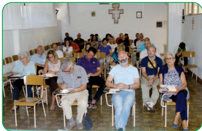
I nostri esercitanti

magnifico considerare come lo Spirito creatore prenda seriamente in considerazione la nostra vita , le nostre scelte, unendosi al nostro cammino continuando sulla strada che liberamente abbiamo scelto di percorrere, anche quando è una strada sbagliata. Non la cancella, non riavvolge indietro il tempo fino a prima della nostra deviazione, ma l'assume integralmente e gli dona una nuova progettualità . Saulo stava andando a Damasco per incarcerare i cristiani,