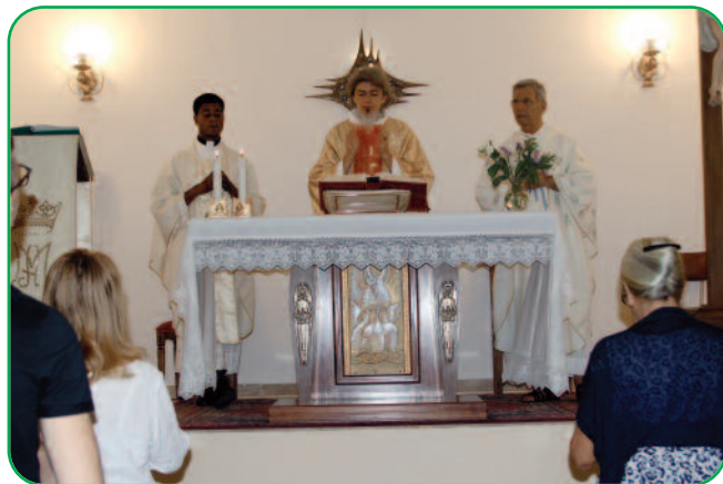
S. Messa dell'Assunta

aleggia, avvolge e penetra ogni realtà. Così come Mosè, ogni volta che entrava nella tenda del convegno, poteva comunicare con Dio perché avvolto dalla sua gloria, dalla Shekinah - la nube luminosa simbolo dello Spirito Santo - che si posava sulla tenda. Anche Gesù ascolta e riceve la parola del Padre, nello Spirito Santo; leggiamo nel vangelo secondo Luca: «Ed ecco, mentre tutto il popolo veniva battezzato e Gesù, ricevuto anche lui il battesimo, stava