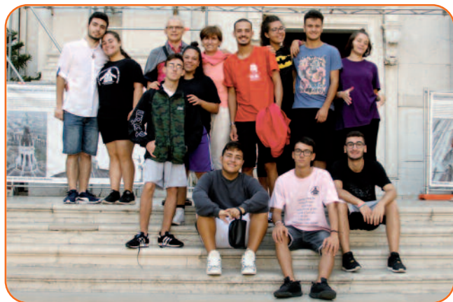
Il gruppo dei giovani davanti alla Basilica di Loreto