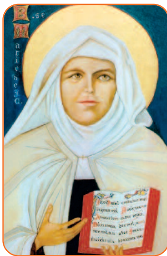
Beata Maria di Gesù Crocifisso, Mariam Baouardy (1846-1878)