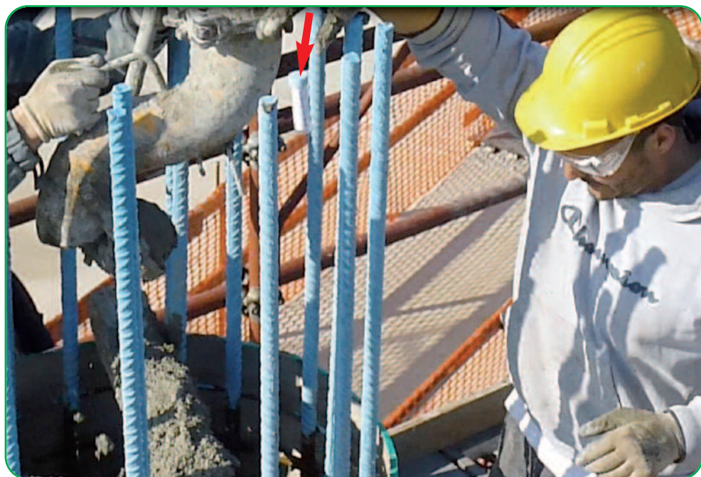
Lancio della boccetta dentro la colonna mentre si getta il cemento