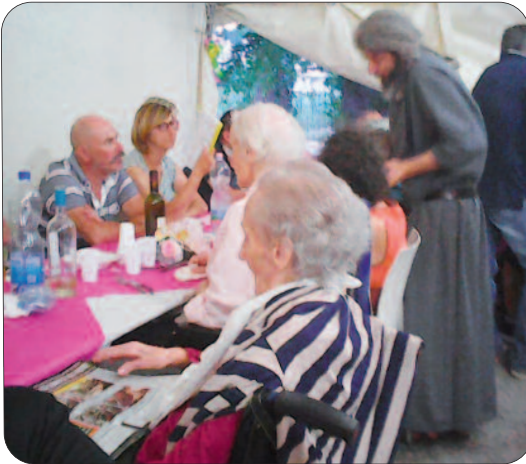
Momenti della festa avuta all'Oasi Ave Maria con i nostri ospiti.

8) Possono far parte dell'Associazione uomini e donne, sacerdoti diocesani, diaconi, religiosi e laici, purché ne accettino sinceramente i fini specifici e siano orientati, nello stile di vita, a consentirne il raggiungimento.