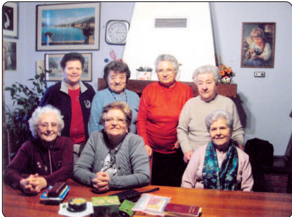
Cenacolo di Arluno MI