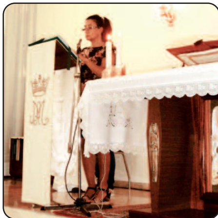
I lettori per la Messa dell'Assunta