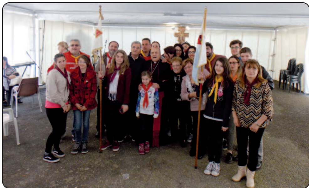
Gruppo Madre del Divin Verbo con il nostro Vescovo il giorno di Pentecoste.