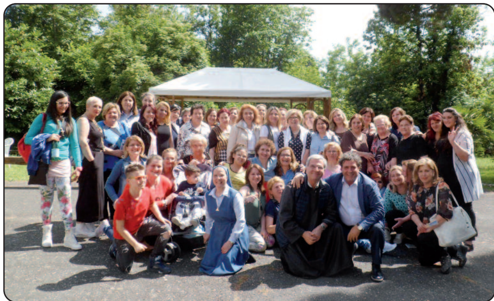
Gruppo di Afragola.