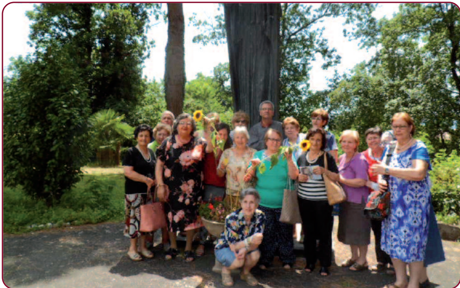
Gruppo di Ponticelli NA