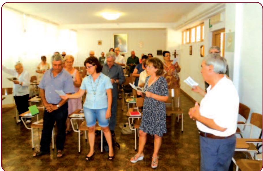
Partecipanti della Settimana Biblica