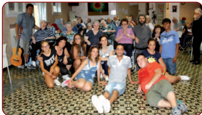
Festa dell'Estate all'Oasi Ave Maria

ORGANIZZATE CENACOLI DI PREGHIERA FAMILIARI, INTERFAMILIARI E PARROCCHIALI. PROMUOVETE LA SANTA MESSA MENSILE VOTIVA DELLO SPIRITO SANTO (MESSALE ROMANO PAG. 844) O IN ONORE DELLO SPIRITO SANTO. PROMUOVETE LA NOVENA IN PREPARAZIONE ALLA FESTA DI PENTECOSTE. VISITATE IL SITO: WWW.SPIRITOSANTO.ORG E PRENDETE VISIONE DELLO STATUTO.