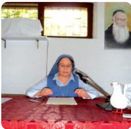
Sr. Laura traccia brevemente i sentimenti dell'Amicizia, della Paura e della Tenerezza.

PAURA. La paura è un sentimento, un'emozione di un'intensa carica di tensione, specialmente quando si verifica un evento che viene vissuto come un pericolo o una minaccia. Esiste un uomo senza paura? Aristotele affermava che l'uomo è coraggioso non in quanto indenne dalla paura, ma in quanto riesce a comportarsi come se non avesse paura. Quindi bisogna convivere e saper gestire la paura. Ad esempio nella malattia cosa più mi spaventa? La sofferenza, l'impossibilità di condurre la mia vita come prima? O la morte? Ciò che conta è che essa non assuma un'intensità tale da impedire il normale corso della nostra esistenza. Certe paure si possono vincere prevenendole. Ad esempio se devo parlare in pubblico mi preparo bene in modo che l'emozione non si trasformi in panico. Se temo il giudizio degli altri che bloccano le mie iniziative penserò che la mia coscienza è il vero giudice.