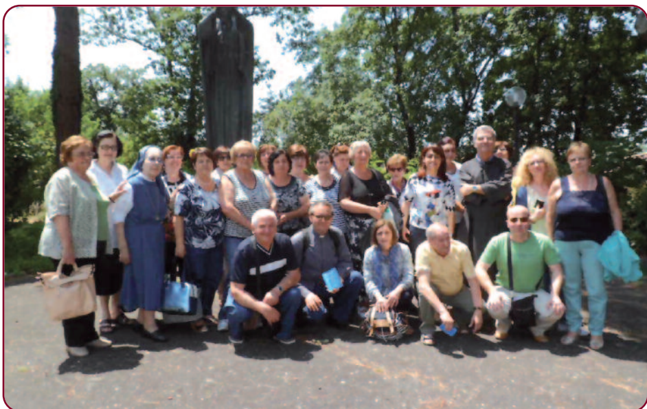
Gruppo di Solofra AV