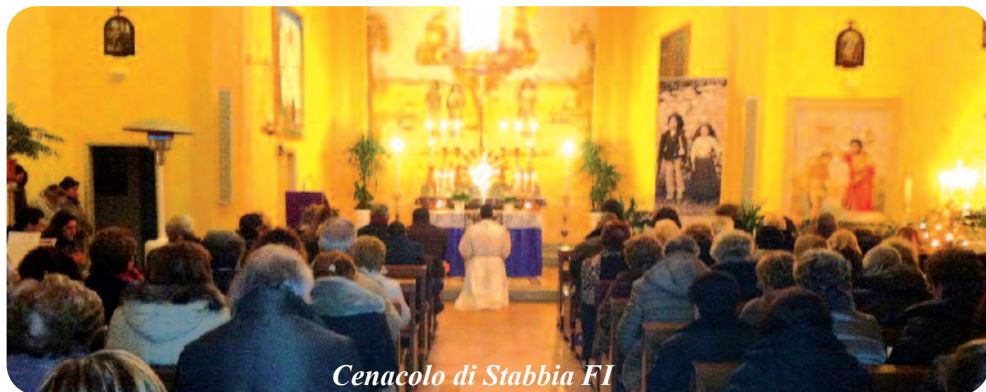
Cenacolo di Stabbia FI