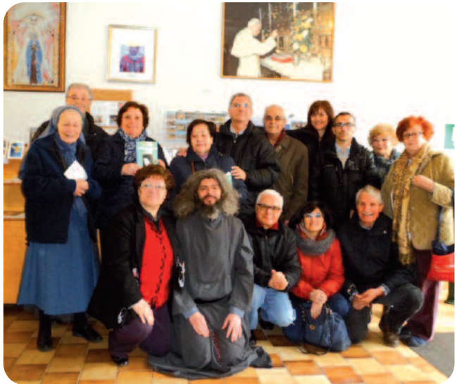
Gruppo di Torino in visita al Centro

Agapito per partecipare all'ordinazione di cinque sacerdoti. E' stato veramente emozionante questo evento e sentivamo lo Spirito aleggiare nella Basilica. Il giorno dopo P. Benedetto ci ha donato una bella catechesi che con la S. Messa ci ha fatto sentire tutti raccolti e intenti ad assimilare le perle preziose per la nostra vita. E' l'amore di Gesù che ci ricompensa di ogni fatica fatta nel suo nome e nella Santa Comunione eravamo ricolmi di amore per lui. Siamo ripartiti ringraziando di vero cuore tutti con l'immagine gioiosa dei vostri volti e saluti alla porta, mentre eravamo sul pullman per la partenza, lasciandoci nel cuore tanta gratitudine e affetto per tutti voi. Siete sempre nelle nostre preghiere, il Signore vi ricolmi di ogni benedizione.