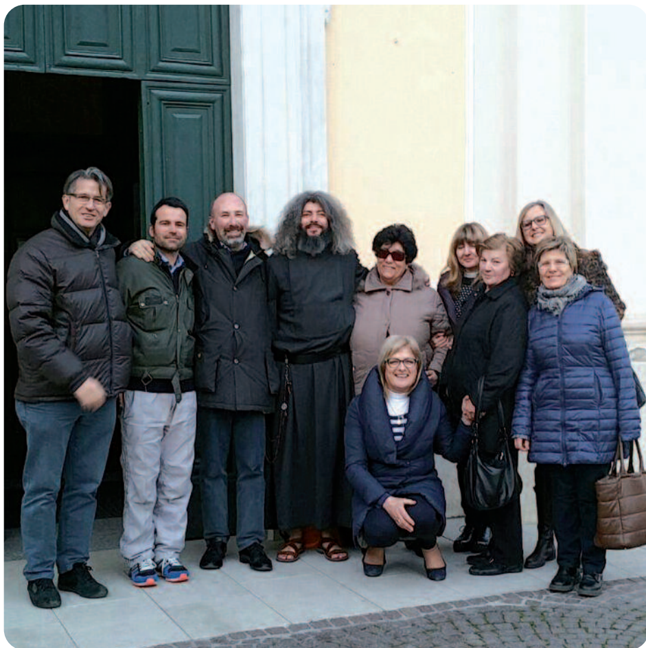
Santuario Madonna della neve Adro

ghiere allo Spirito Santo, perché ogni fedele cristiano cattolico in segno di profondo rispetto, baciando quelle mani consacrate con il Sacro Crisma, possa far sentire ai nostri Sacerdoti il conforto e la consolazione nel loro ministero sacerdotale, sapendo che le loro pecorelle li amano e li portano sempre nel loro cuore!