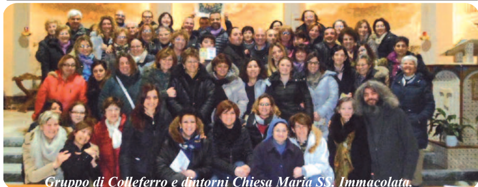
Gruppo di Colleferro e dintorni Chiesa Maria SS. Immacolata.

ORGANIZZATE CENACOLI DI PREGHIERA FAMILIARI, INTERFAMILIARI E PARROCCHIALI. PROMUOVETE LA SANTA MESSA MENSILE VOTIVA DELLO SPIRITO SANTO (MESSALE ROMANO PAG. 844) O IN ONORE DELLO SPIRITO SANTO. PROMUOVETE LA NOVENA IN PREPARAZIONE ALLA FESTA DI PENTECOSTE. VISITATE IL SITO: WWW.SPIRITOSANTO.ORG E PRENDETE VISIONE DELLO STATUTO.