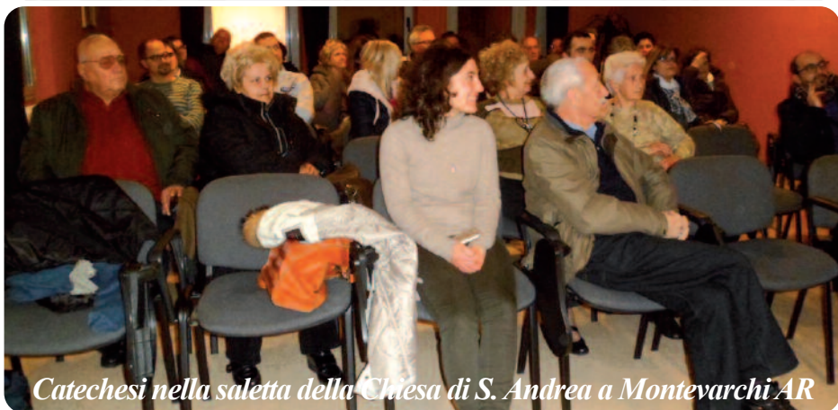
Catechesi nella saletta della Chiesa di S. Andrea a Montevarchi AR