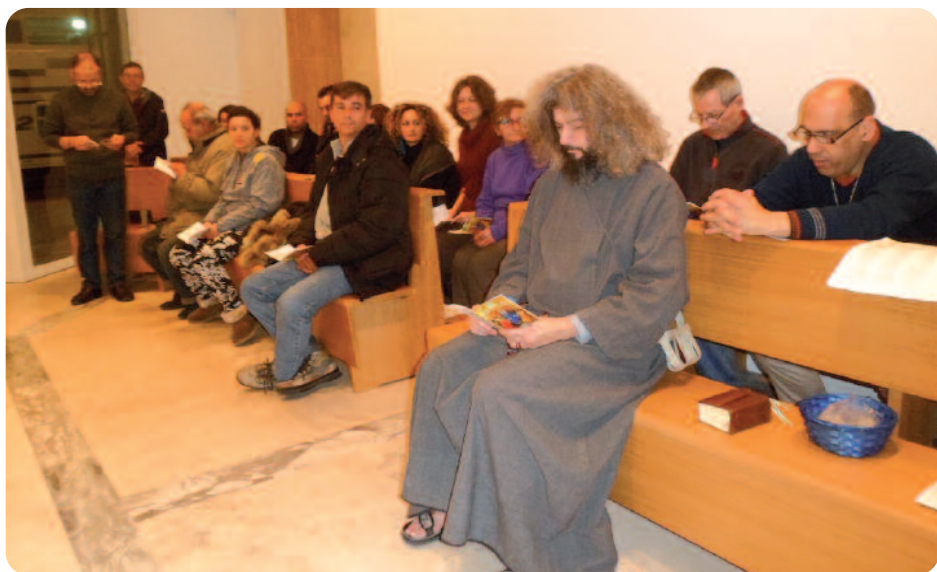
Cenacolo nella cappellina della stazione di Firenze

rienza di un cenacolo in cui fare memoria di alcuni Sacramenti della nostra iniziazione cristiana, dove agisce e si rende efficace l'azione dello Spirito Santo.