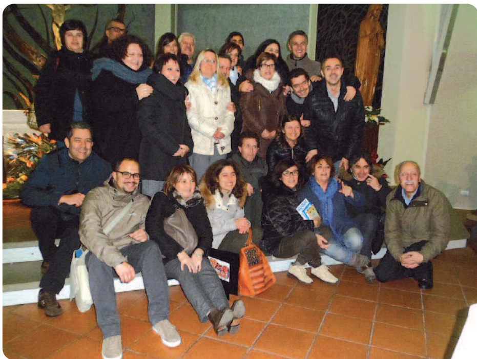
Cenacolo di Montevarchi e di S. Giovanni Valdarno AR

na, ai vari cenacoli (ma anche a realtà nascenti), che si formano sotto l'impulso dello Spirito Santo, aderendo al carisma di far conoscere, amare e glorificare lo Spirito Santo. P. Basito ha affrontato alcune tematiche significative che riguardano la nostra vita in Cristo come la conformazione a lui, la lotta spirituale e la dinamica delle tentazione, ma soprattutto alla pratica e alla fedeltà a quelli che vengono definiti come i "Capolavori dello Spirito Santo" secondo il Catechismo della Chiesa