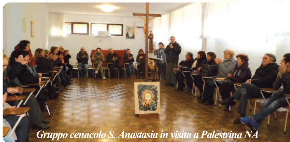
Gruppo cenacolo S. Anastasia in visita a Palestrina NA