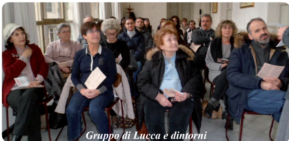
Gruppo di Lucca e dintorni