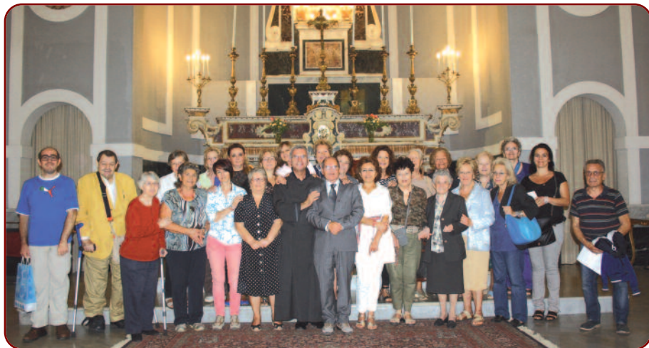
Parrocchia S. Maria della Libera

Tutte le informazioni sull'Opera, sulla sua spiritualità e sulla sua attività, sono soltanto quelle documentate nel sito www.spiritosanto.org