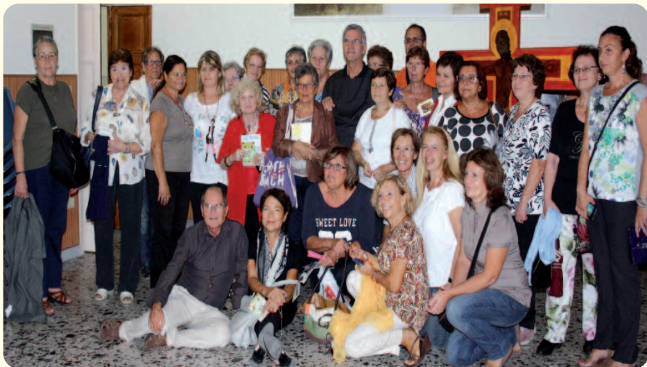
Parrocchia Maria SS. Desolata