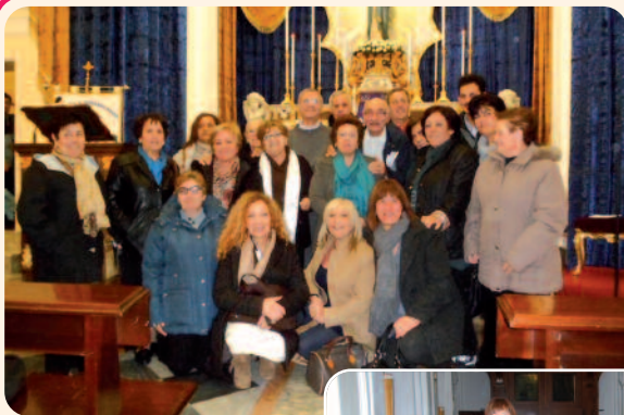
Cenacolo di Forio-Ischia

vamente il nostro Presidente ci ha parlato di quanto si sta attuando, con amore e determinazione, per portare avanti i lavori di costruzione del Tempio. Quanto ha esposto il Presidente è stato confermato dall'eccellente lavoro svolto da Fra Alberto che ci ha fatto pervenire alcuni filmati di grande interesse che hanno dimostrato come, pur in questo momento economicamente infelice, i lavori proseguono alacramente e con estrema precisione. La benedizione di P. Basito ha concluso la stupenda giornata di fraternità apostolica.