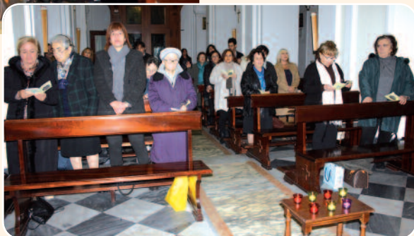
Cenacolo di Panza-Ischia