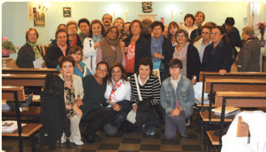
Chiesa S. Giuseppe custode del Redentore