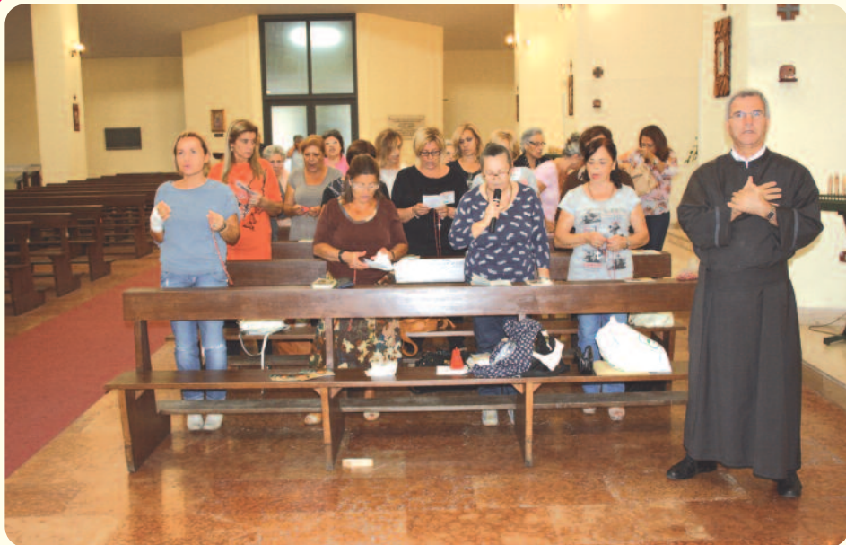
Chiesa SS. Redentore e S. Ciro