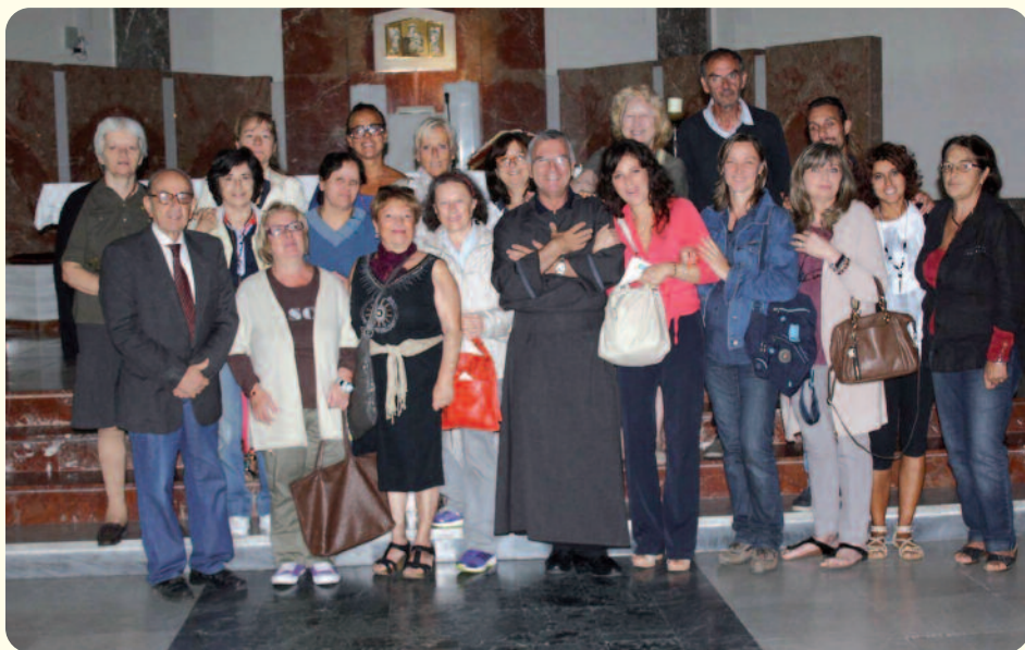
Chiesa San Giovanni Battista ai Fiorentini