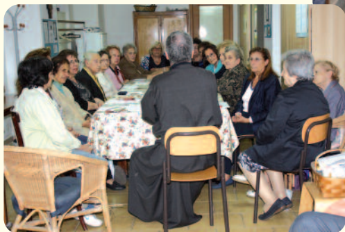
Parrocchia S. Gennaro al Vomero