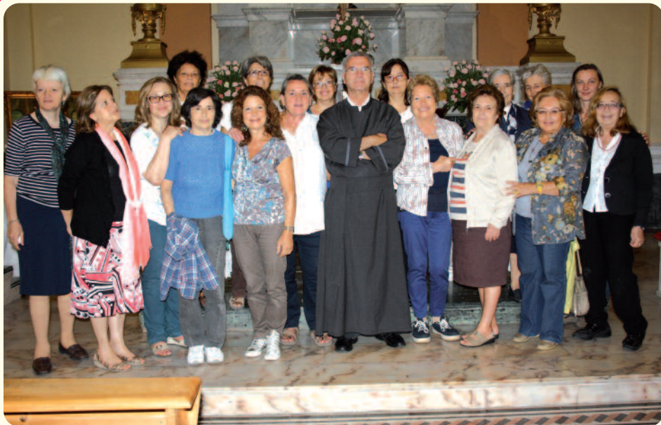
Chiesa Sant'Anna all'Arenella