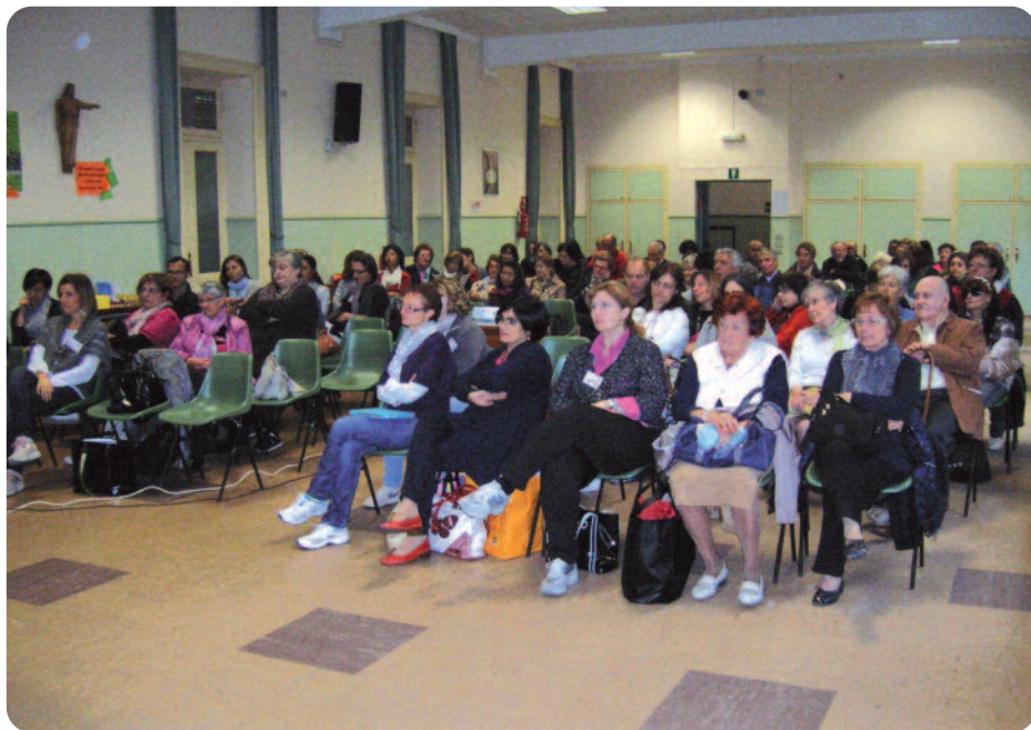
Ascolto dell'intervento del Presidente ai radunati dei Cenacoli di Torino