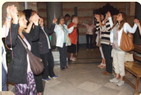
Chiesa San Francesco ad Antignano