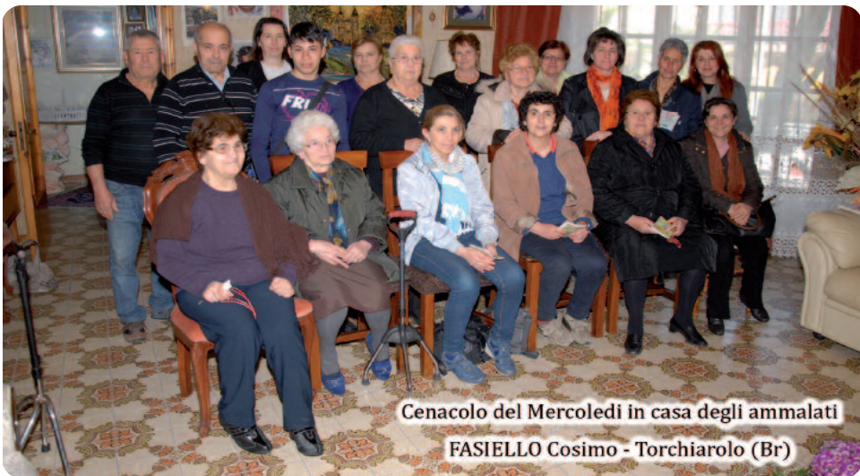
Cenacolo del Mercoledì in casa degli ammalati