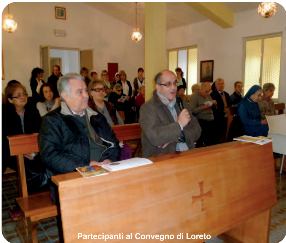
Partecipanti al Convegno di Loreto

con proposte che possano coinvolgere oltre che la propria parrocchia, anche le altre, con iniziative diocesane. L'entusiasmo è tanto, come pure il fervore e l'amore per lo Spirito Santo, che porta sempre novità alle cose e trasforma gli eventi in grazie speciali utili per il bene di tutti. “Essere Discepoli e Apostoli dello Spirito Santo significa essere discepoli di Gesù nello Spirito Santo. Se la devozione allo Spirito Santo porta all'amore per Gesù, lo ascolto, e lo