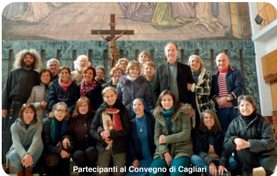
Partecipanti al Convegno di Cagliari

Carissimi, i Convegni dell' Associazione Pubblica Laicale "Potenza Divina d'Amore", con la partecipazione dei religiosi Discepoli e Apostoli dello Spirito Santo , svoltosi uno a Loreto e l'altro a Cagliari, ci danno la possibilità di sondare il livello di maturazione spirituale del nostro carisma, per il culto allo Spirito Santo. Infatti abbiamo riscontrato il desiderio di comunicare sempre più l' esperienze e di poter allargare i propri confini dei gruppi di cenacoli,