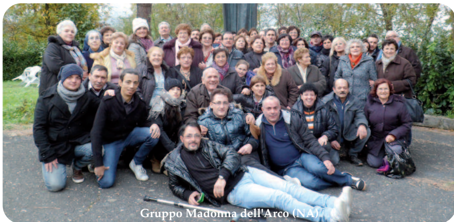
Gruppo Madonna dell'Arco (NA)