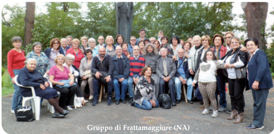
Gruppo di Frattamaggiore (NA)