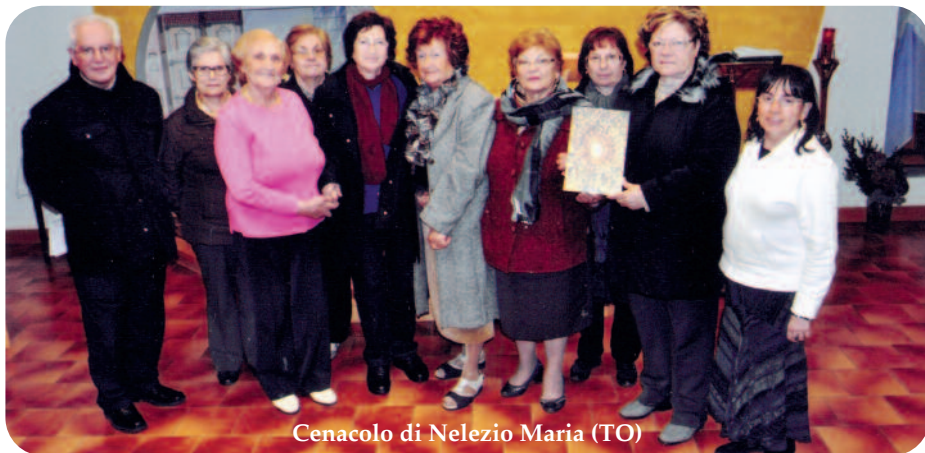
Cenacolo di Nelezio Maria (TO)