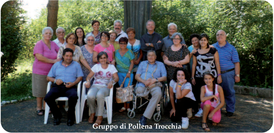
Gruppo di Pollena Trocchia