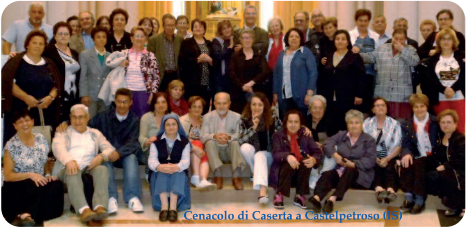
Cenacolo di Caserta a Castelpetroso (IS)