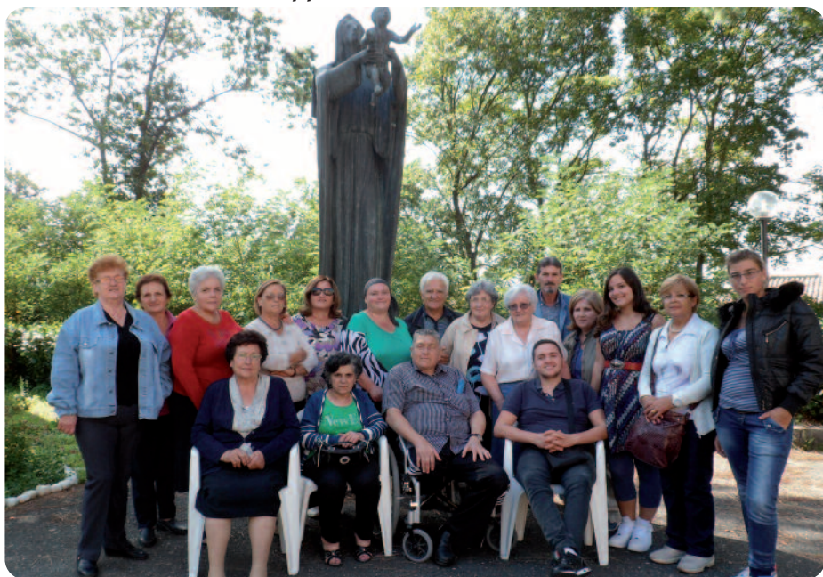
Gruppo di Pollena Trocchia