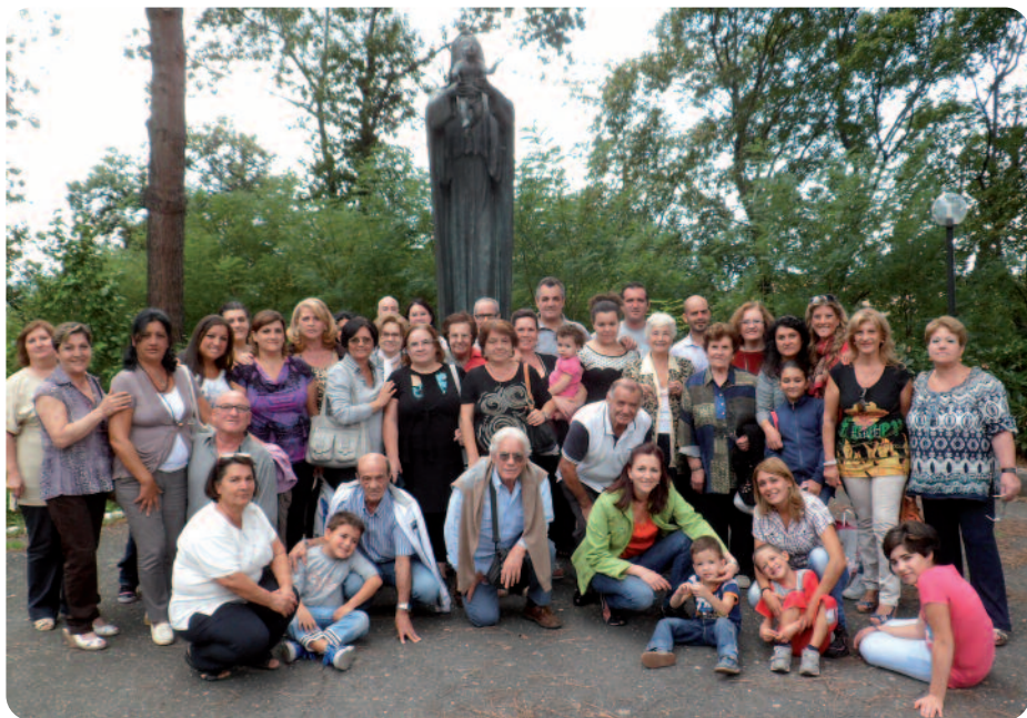
Gruppo di Caserta e dintorni