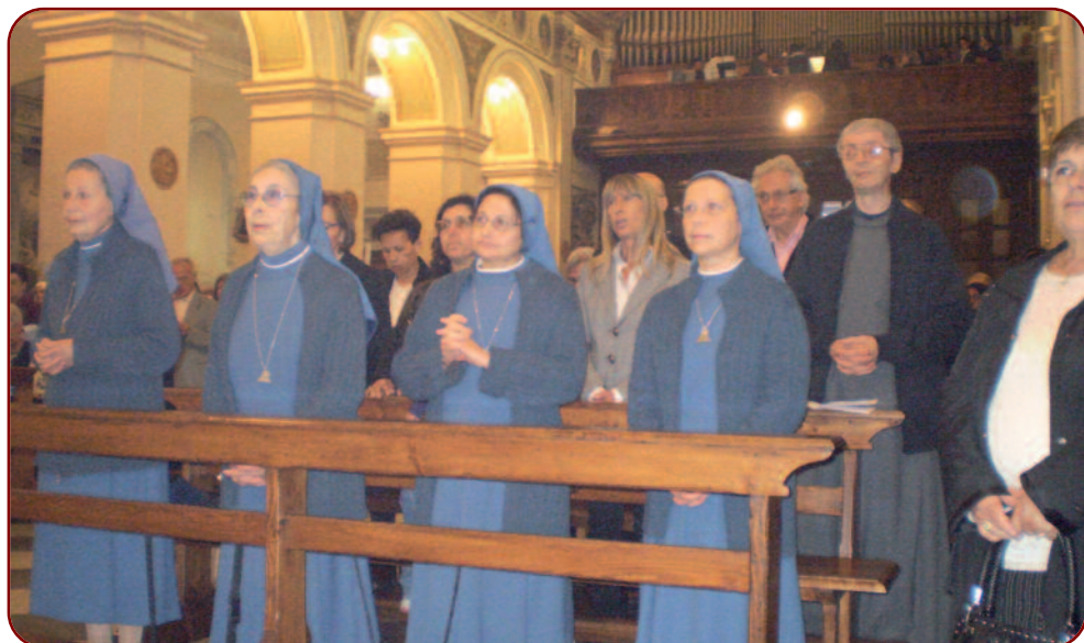
Cattedrale S. Agapito 15/5/20012. Le Sorelle e il Fratello ricevono dal Vescovo il Ministero straordinario della Comunione