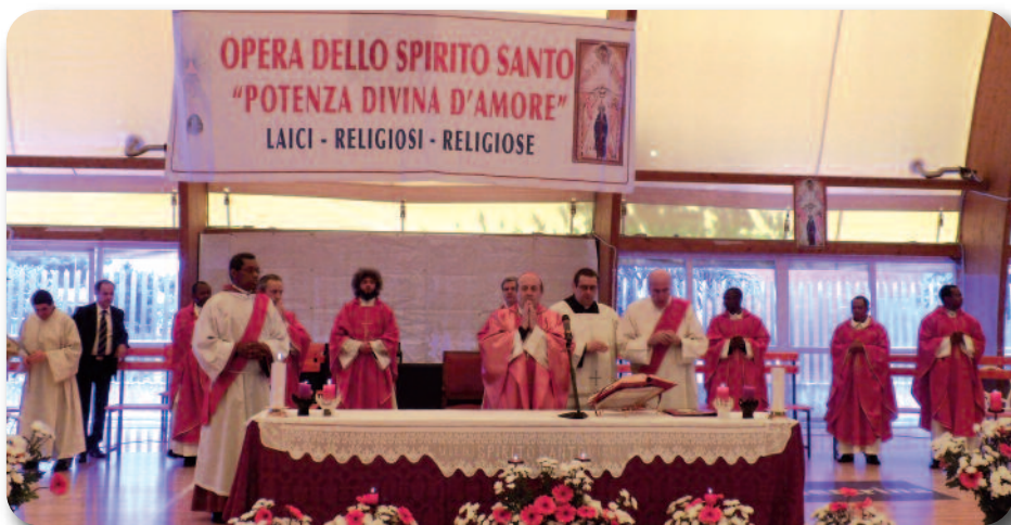
Celebrazione solenne della Pentecoste presieduta dal Vescovo Domenico Sigalini al Pala Iaia

ventuno ci siamo diretti al palaz- zetto dello Sport Pala Iaia per la veglia dove insieme a tutti gli altri fedeli della diocesi abbiamo pregato lo Spirito Santo per in-