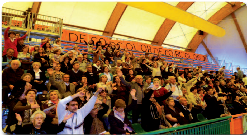
Pregiere e canti al Pala Iaia