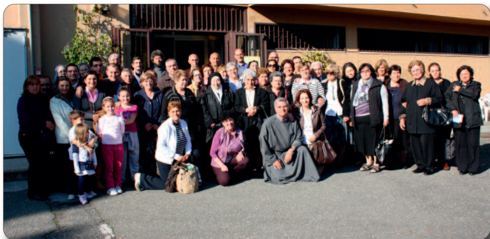
Gruppo di Crispano (NA) in visita al nostro Centro