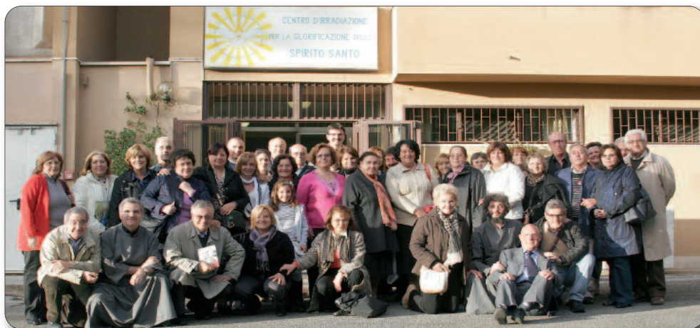
Gruppo di Frattamaggiore (NA) in visita al nostro Centro