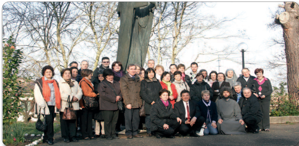
Gruppo di Imola (BO) in visita al nostro Centro