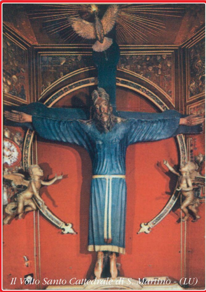
Il Volto Santo Cattedrale di S. Martino - (LU)

Le richieste telefoniche di materiale per l'apostolato, vengono accolte dal lunedì al venerdì nei seguenti orari: 9.00 - 14.00 e 16.00 - 18.00