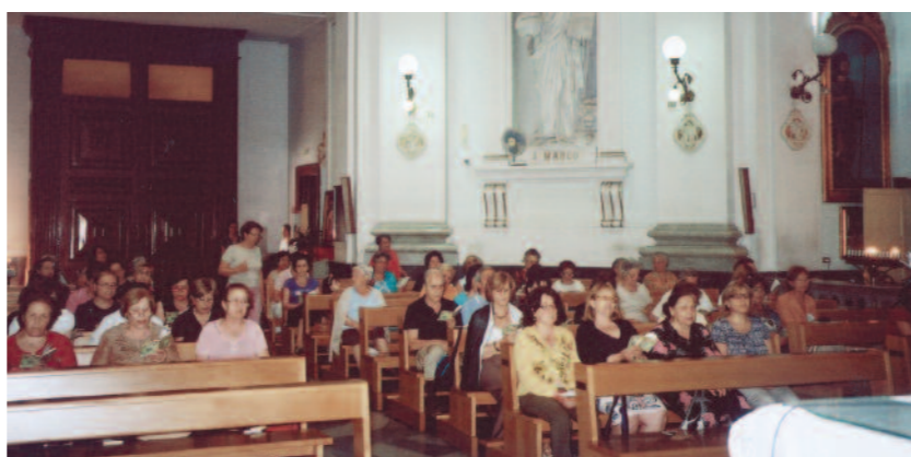
Cenacolo nella chiesa di San Rocco a Frattamaggiore (Napoli).