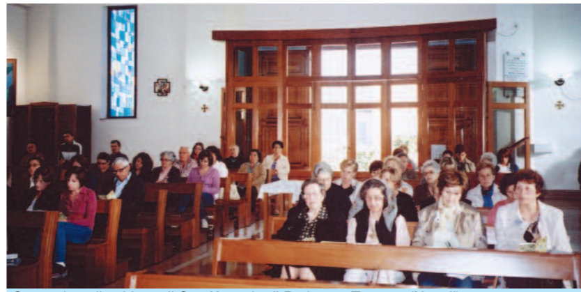
Cenacolo nella chiesa di Sant'Antonio di Padova a Trecase (Napoli).