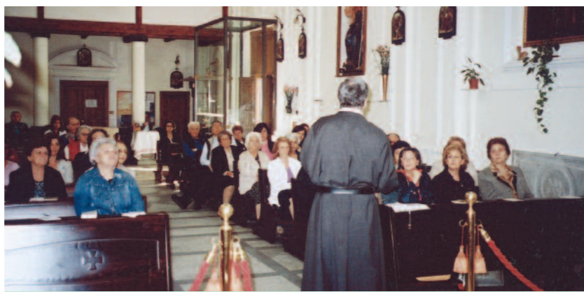
Cenacolo nella chiesa della Santissima Annunziata a Pollena Trocchia (Napoli).