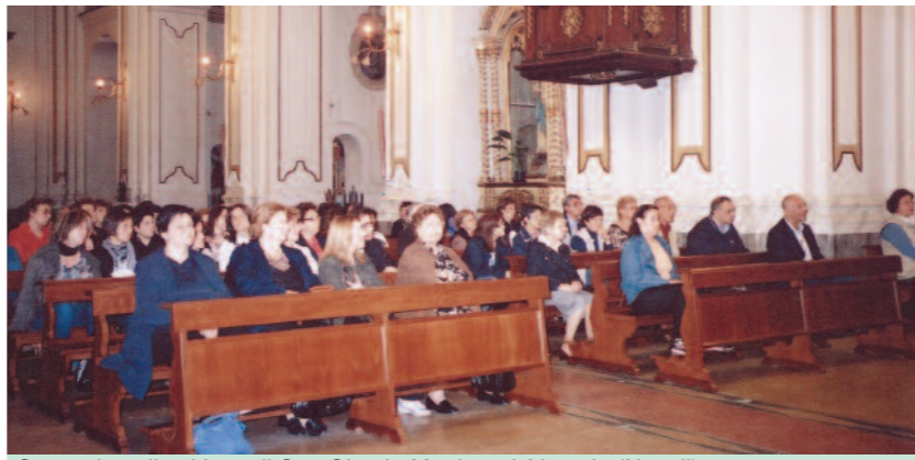
Cenacolo nella chiesa di San Giorgio Martire ad Afragola (Napoli).