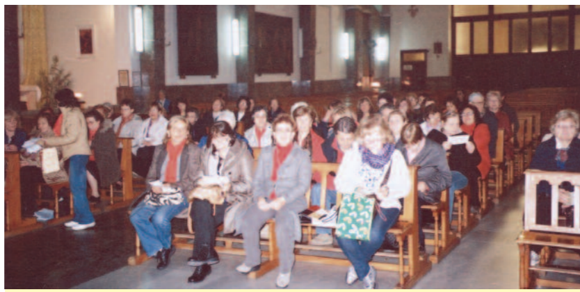
Cenacolo nella chiesa dei Fiorentini a Napoli.

Le causale è obbligatoria per i versamenti a favore delle Pubbliche Amministrazioni. Le informazioni richieste vanno riportate in modo identico in ciascuna delle parti di cui si compone il bollettino.