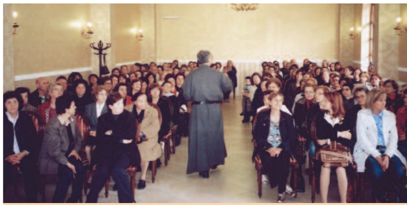
Cenacolo nella chiesa di San Gregorio Magno a Crispano (Napoli).