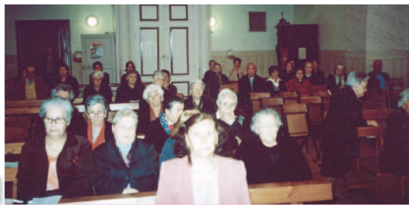
Cenacolo nella chiesa nuova di Maria Immacolata a San Bartolomeo in Galdo (Benevento).