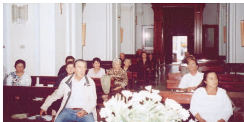
Cenacolo nella chiesa di San Leonardo Abate a Panza d'Ischia (Napoli).