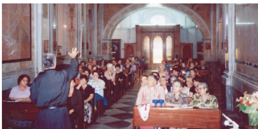
Cenacolo nella chiesa della Madonna del Soccorso a Napoli.