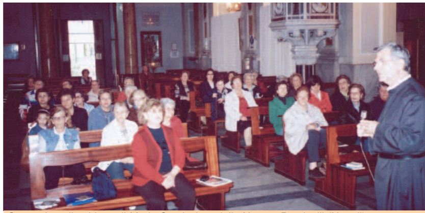
Cenacolo nella chiesa di Maria Santissima della Neve a Ponticelli (Napoli).