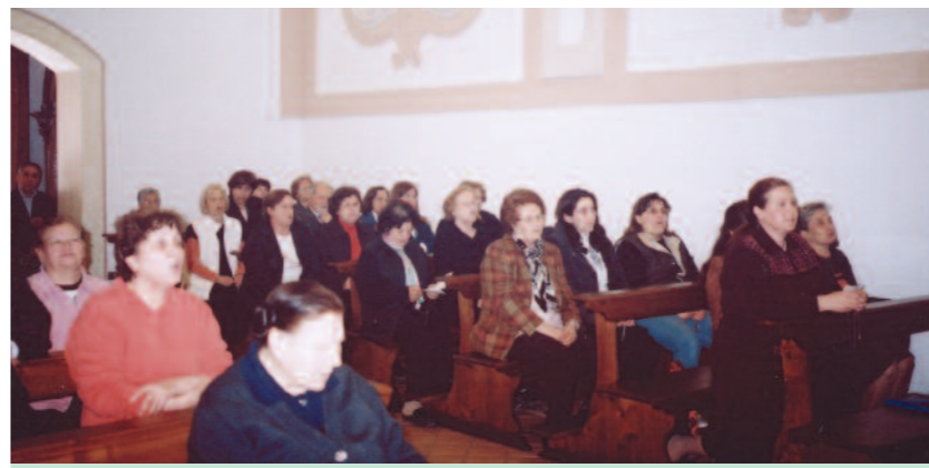
Cenacolo nella chiesa di Sant'Elpidio Vescovo a Sant'Arpino (Caserta).