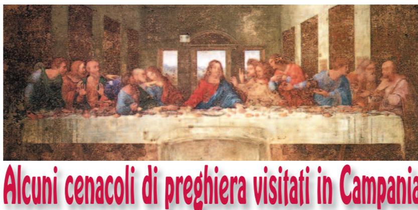
Cenacolo nella chiesa di San Rocco a Frattamaggiore (Napoli).